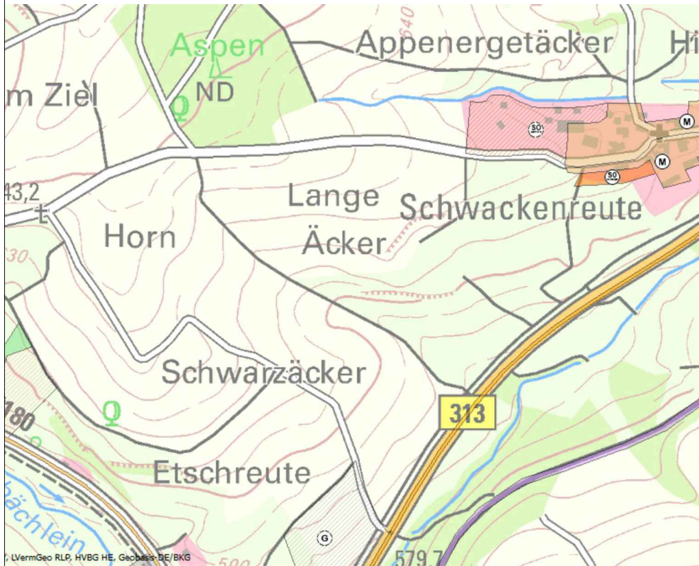
Darstellung im wirksamen FNP